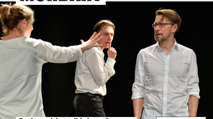
Das improvisiertes Krimvergnügen Die Hottenlotten