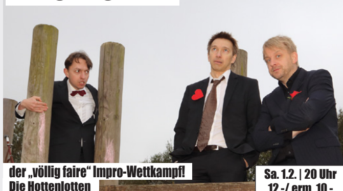
der „völlig faire“ Impro-Wettkampf! Die Hottenlotten